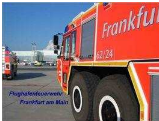
Simba 8x8 HRET (Flughafenfeuerwehr Frankfurt)