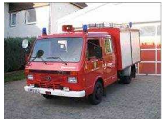
TSW (FFW Reichenborn)